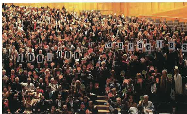
Acte de celebració de les 100.000 parelles lingüístiques (26 de novembre del 2015)